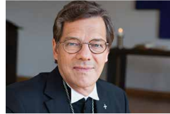
Bischof Markus Dröge

Ich möchte Sie einladen, in den Gemeinden und Einrichtungen unserer Kirche miteinander über die Themen dieser Broschüre ins Gespräch zu kommen. Die hier gesammelten Informationen und Diskussionsgrundlagen mögen Sie dabei unterstützen.